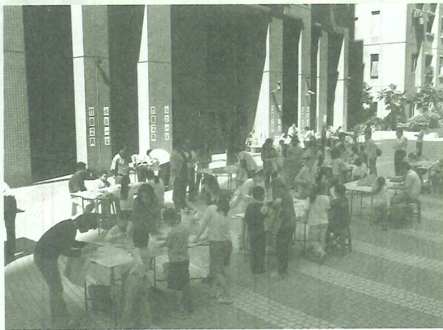
觀海極品社區在社區一家成果展時，舉辦的製旗活動吸引上百餘民眾到現場，熱鬧非凡

在商圈的問卷調查上，我們訪問了竹圍生活圈約400多家商店，有效問卷241份，願意加入商圈聯誼會的有173戶，這些都已成為我們以後社區營造的重要資源。而製旗活動於95年4月22日(星期六)早上舉行，我們邀請店家進入觀海極品社區繪旗，當日吸引了200多人的參與，所有作品用麻繩串起掛在土地公廟展出兩星期，頗受矚目，或許已讓金色竹圍的名號逐漸打響。打造竹圍優質的形象商圈是我們社造團隊的一致目標，透過問卷調查和邀請店家製作代表店家特色的旗