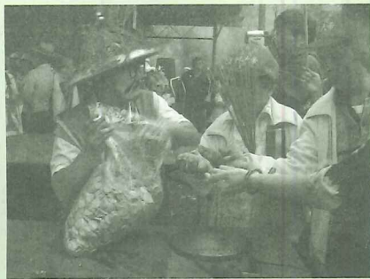
優等獎「祈求平安」