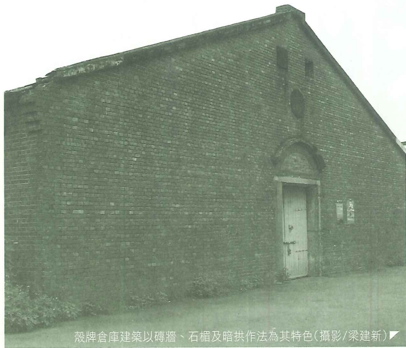
殼牌倉庫建築以磚牆、石槓及暗拱作法為其特色

淡水殼牌倉庫(英商嘉士洋行倉庫):淡水文化史蹟群中重要的環點,在1997年團體的結盟搶救淡水河行動中,被幸運的保存延續、然而:現在這個倉庫再度面臨著來自官方四千萬鉅額片面求償的壓力、要將他們一起毀滅。