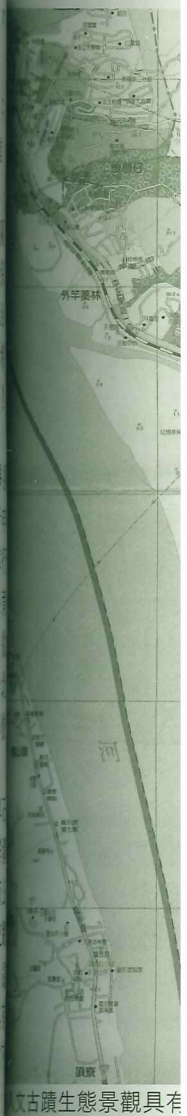
淡水古蹟生態景觀具有