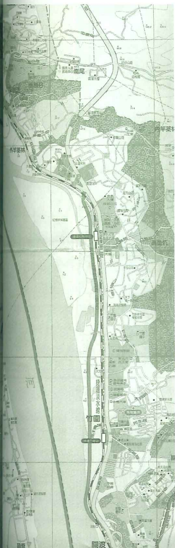
讓生態景觀具有多元價值