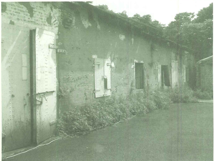
殼牌倉庫斑駁的牆垣,訴說著歷經風風雨雨的滄桑