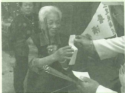
優等獎「換香」

主辦單位提供獲選優等作品每件獎金1,500元及獎狀，獲選佳作者每件獎金800元；期待藉由本次攝影活動舉辦的基礎，未來能廣邀更多攝影同好共襄參與，忠實紀錄八庄大道公信仰的風貌，讓大家透過攝影角度來認識淡水多元的文化內涵。