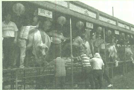
優等獎「賽豬公」