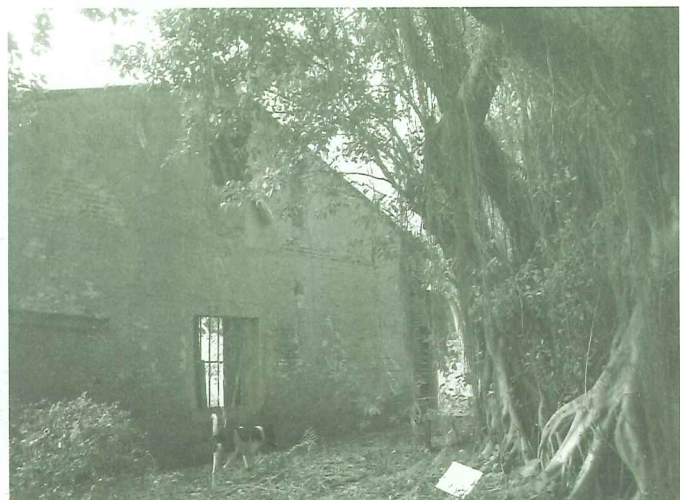
保留原始風貌的殼牌倉庫一隅

沒有「搶救淡水河行動聯盟」的努力。我們很難想像今天沿河的親水步道，腳踏車，陽光，休閒與親水的景觀。沒有沿河古老史蹟與親水文化的存續，我們很難夢想先祖辛苦的驛路並告訴我們的子孫如何。殼牌倉庫從歷史的糾結與沉睡中甦醒，一點一滴的告訴我們淚水的過去與微笑的未來…微笑？是的，我們的微笑需要您、我、大家來散播。